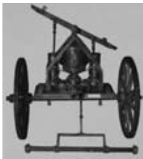
Пеший трубный ход, 1890 год

Тушение пожаров в то время проходило достаточно организованно, пожарным в их работе помогала и воинская команда. Место пожара оцеплялось полицией для поддержания порядка и обеспечения сохранности выносимого имущества. Однако пожары всегда являлись событием из ряда вон выходящим и привлекали массу зрителей, мешающую действиям пожарных. С этим постоянно приходилось бороться. Так, 30 мая 1872 года Курский полицмейстер распространил по городу объявления, в которых напоминал жителям, что статья № 82 Пожарного устава запрещает съезжаться на пожар ради любопытства и мешать пожарным и полиции. В объявлении указывалось, что на последних пожарах, имевших место в Курске, происходили беспорядки: собирались толпы зрителей, некоторые обыватели прорывались через кольцо оцепления и своими советами и вопросами мешали пожарным. Полицейстер предупреждает обывателей, что согласно ст. 29 и 138 Пожарного устава на лиц, нарушающих порядок на пожарах, будут налагаться штрафы до 15 рублей, кроме того, виновных будут привлекать к работам по тушению пожара.