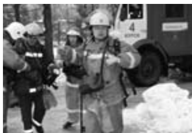
По сложной вводной