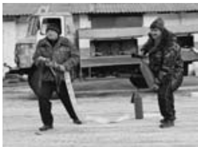
ДПД производит боевое развертывание.

То, что агропромышленное хлебоприемное предприятие ООО «Солнцевское АХП» относится к категории взрывопожароопасных, видно и невооруженным глазом. На территории — чистота и порядок. Где надо, расставлены пожарные щиты, ящики с песком. В центре городка — гараж, где на чеку денно и нощно стоит пожарная автоцистерна.