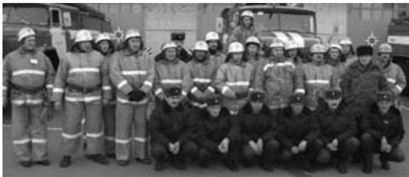
Коллектив ПЧ Фатежского района