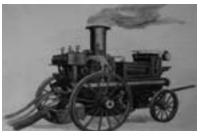
Английская паровая пожарная машина

9 мая 1865 года в городе Тим выгорел весь культурный центр: сгорело 47 торговых лавок и 77 дворов.