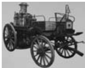
Немецкая паровая машина

Курское пожарное общество по мере своего становления и накопления капитала усиливало свое влияние на укрепление