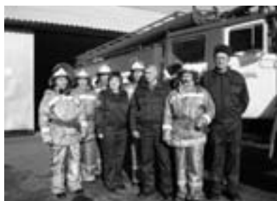
Перед боевым дежурством (2007 г.)