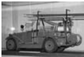
Макет первого пожарного автомобиля АМО—Ф—15

Тройкам предписано определять годность огнегасительных снарядов, машин и пожарного имущества. В их обязанности входила профилактическая работа по предупреждению возгораний: очищение дымовых труб и удаление с чердаков ненужного горючего мусора, недопущение разведе-