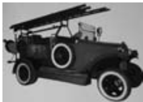
Автонасос «подстволовой» (1927 г.)

Занятия проходили в классах земельного училища. В начале 1921 года курсам было передано помещение бывшей ремесленной школы, двухэтажное кирпичное здание. Новый набор курсантов составил уже 40 человек. При курсах был основан небольшой, но ценный музей, ярко иллюстрирующий постепенное развитие пожарного дела и служащий наглядным учебным пособием для курсантов. В течение 1921— 1924 годов курсы сделали 5 выпус-