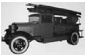
Автонасос ГАЗ—АА (1932 г.)

ния костров и курения вблизи огнеопасных строений и складов. Тройки должны следить и за тем, чтобы в каждом доме и учреждении постоянно находился запас воды в количестве не менее 5 ведер. Исполнение приказа возлагалось на начальника милиции. Несоблюдение требований троек каралось судом по законам военного времени.