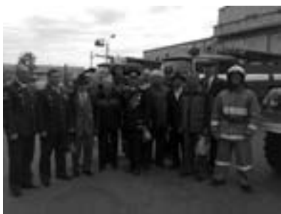
В одном строю с ветеранами (2008 г.)

1 января 2009 года пожарная часть Щигровского района включена в состав федеральной группировки и получила наименование 13-ой пожарной части по охране г. Щигры Государственного учреждения «1 отряд ФПС по Курской области». Штатная численность части 54 человека. На вооружении имеются 4 основных пожарных автомобиля (автоцистерны), 1 специальный (автолестница), 3 вспомогательных.