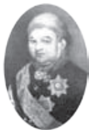
Генерал-губернатор Курского наместничества А.А. Беклешов, 1745—1808 гг.

Прежде всего, были измерены дворы курских жителей площадью более 100 квадратных саженей. Та-