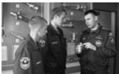
Во время экскурсии

Курские огнеборцы изучают тактику тушения пожаров, пожарную профилактику объектов и населенных пунктов, устройство пожарной и аварийно-спасательной техники. Главное в обучении — практика, поэтому большое внимание уделяется физической, технической и пожарно-строевой подготовке. Помимо аудиторных, активно проводятся выездные занятия на базе пожарно-спасательных подразделений Курской области.