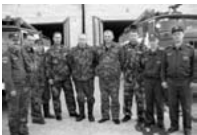
дежурный караул ПЧ

На обслуживании района была всего одна машина, свой караул располагался и в Любимовке.