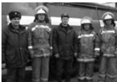
Готовимся к борьбе с огнем