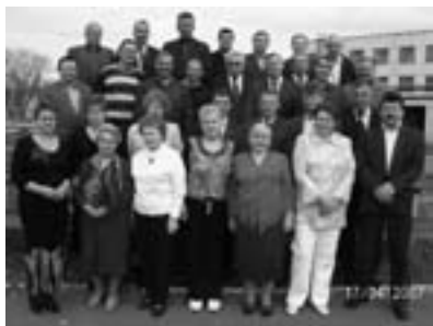
Ветераны ППС (2007 г.)

области проводилась работа по укомплектованию кадрами аппарата управления вновь создаваемой службы, решались вопросы финансирования и материально-технического обеспечения.