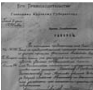
Фрагмент рапорта Курского полицмейстера Курскому губернатору о снятии с должности пожарного за ненадлежащее исполнение обязанностей, 4 июня 1892 г.

та 1 бочка на 10 дворов, 4 багра, 2-е вил, 4 длинных топора, 4 лопаты, 2 лестницы, 1 веревка, 1 войлочный щит в 36 квадратных аршин. В случае приобретения пожарной трубы 50% ее стоимости гасилось за счет страховых взносов. Лошадей для тушения пожара поставляли все дворы по пожарному расчету или по распоряжению пожарного старосты.