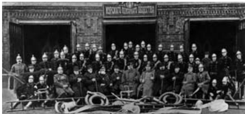
Курское пожарное общество, 1906 г.