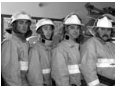
Пожарный караул (2009 г.)