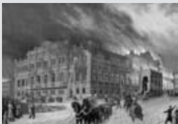
Пожар в Дворянском собрании (сейчас в этом здании находится Дом офицеров Курского гарнизона)

17 октября 1892 года был замечен дымок, выбивавшийся из-под крыши здания Дворянского собрания. Огонь быстро охватил все здание. К месту пожара были стянуты все имеющиеся силы и средства пожаротушения, однако справиться с огнем они не могли. К вечеру стало ясно, что пожар в здании потушить быстро не удастся, и тогда основные силы были направлены на