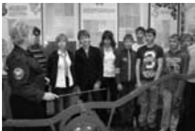
Во время экскурсии

года пожарно-технический центр посетили 1752 человека, было проведено 84 экскурсии.