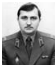
Репин Иван Васильевич 1987—1992 гг.