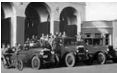
Курские огнеборцы 40-х годов XX столетия

ков с общим числом курсантов 45 человек, 96% курсантов получили обеспечивающие их должности. В 1924 году курсы были переведены в здание бывшей 4 пожарной части, построенное по требованию современной пожарной техники и оборудованное необходимым инвентарем и пожарным обозом. Теоретическое обучение на курсах продолжалось 2 года. Слушатели курсов объединяются в Курсантскую пожарную команду с 4-х сменным боевым дежурством по охране города. Учебная команда имела свой район выезда и выезжала на тушение пожаров, курсанты участвовали также в работе губпожарной инспекции. Обучение заканчивалось прохождением практики в управлении пожарной охраны города, железной дороги и в пожарных частях города. В 1925 году курсы насчитывали 37 человек, имели пожарный обоз из 3 автоходов боевого выезда и 3 ходов учебного выезда. В 1925 году был построен учебный городок в 4 этажа. При курсах находился музей, культурная комиссия, драмкружок, испытательная станция, две подшефные деревни. 1 марта 1926 года в Курске при Пожарной части курского отделения железной дороги начинают работу 2-годовые Курсы пожарных техников.