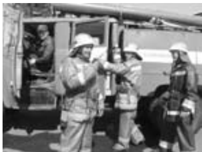
Тренировка пожарного расчета