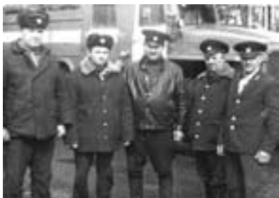
Первый пожарный караул (1952 г.)