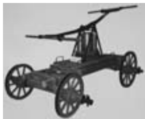
Макет насосной бочки, 1860—1890 гг.

В 1913 году в Курском пожарном обществе состояло 8 почетных членов, 47 действительных членов, 3 члена-жертвователя, 67 дружинников. Вольная пожарная дружина имела на вооружении: 1 линейку для перевозки пожарной трубы, 1 пожарную трубу производительностью 20 ведер в минуту при одновременной работе 16 человек, 4 багра, 2 лома, лестницу-штурмовку, необходимое пожарное снаряжение. Пожарное Общество имело свой флаг с названием общества и оркестр.