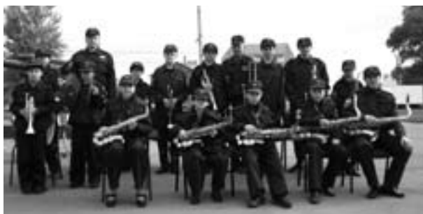
Гордость ППС (2007 г.)

безопасности учреждением, награждена Почетной грамотой, переходящим вымпелом и кубком «Лучшему учреждению подведомственному комитету ГОЧС и пожарной безопасности Курской области».