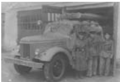
Пожарный расчет части (1950–1960 г.г.)

1 июня 1967 года происходит объединение объектовой пожарной команды Льговского сахарного завода с профессиональной пожарной частью. Численность личного состава увеличивается с 31 до 40 человек. В части создается кустовая бухгалтерия, которая обслуживает Льговскую, Конышевскую ППЧ и ППЧ им. Карла Либкнехта. В часть поступает новая пожарная техника. Ранее находившиеся на