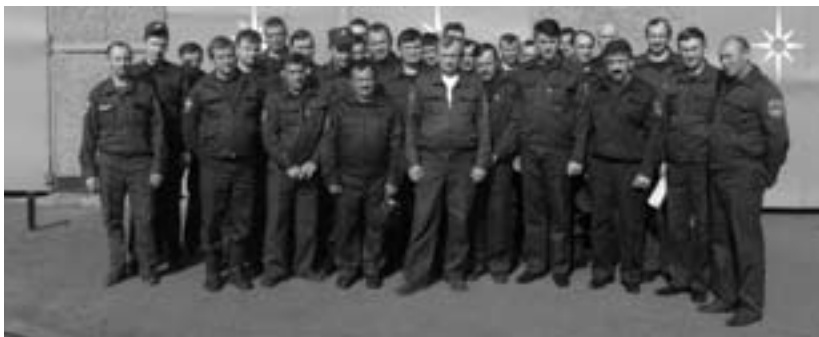
Коллектив ПЧ Золотухинского района

К сожалению, данных об истории создания и работы Золотухинской пожарной части до 1973 года в районе не сохранилось. Связано это с тем, что не раз эта структура подвергалась реорганизации, меняя место базирования.