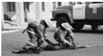
Пожарные на тренировке

Огнеборцами Октябрьского района в 2008 году была одержана победа в областном конкурсе звеньев газодымозащитной службы.