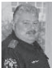
Заместитель начальника Главного управления МЧС России по курской области, начальник Управления ГПН — главный государственный инспектор Курской области по пожарному надзору

каменных стен вокруг городов, которые служили не только в военных оборонительных целях, но и защищали города от нередко возникавших в те годы массовых пожаров в бедняцких пригородах — слободах.