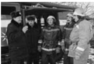
Караул с задачей справился

Существенную работу по пропаганде пожарной безопасности и тушению пожаров сегодня оказывает пожарный пост, созданный в селе Старый Лещин. Для него выделена автомашина, набран личный состав в количестве 10 человек. Пост работает с 1 января 2009 года и уже показал свою эффективность. В зоне ответственности старолещинских пожарных три сельских совета — это 15 на-