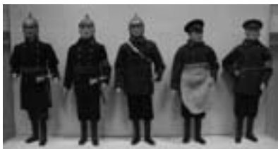
Форма пожарных, конец 18-го века

О Пресвятая и Преблагословенная Мати Сладчайшаго Господа нашего Иисуса Христа, припадаем и поклоняемся Тебе пред святою и пречестною иконою Твоею, ею же дивная и преславная чудеса содеваеши, от огненного за- паления и молниеноснаго грома жилища наша спасаеши, недужныя исцеляеши и всякое благое прошение наше во благо исполняеши. Смиренно молим Тя, всесильная рода нашего Заступнице: сподоби ны немощныя и грешныя Твоего матерняго участия и благопопечения. Спаси и сохрани, Владычице, под кровом милости Твоея Церковь Святую, обитель сию, град сей, всю страну нашу православную, и вся ны припадающия к Тебе с верою и любовью, и умиленно просящия со слезами Твоего заступления.