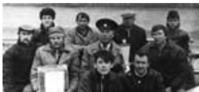
Пожарные дружны со спортом