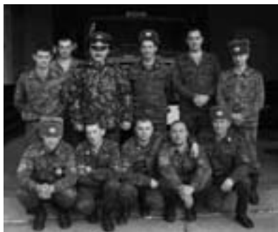
Смена прошла без замечаний