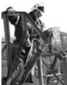
на рабочей высоте

Специфика района выезда пожарных состоит в том, что объекты ОАО «Михайловский ГОК» расположены на 13600 га, из которых 1522 га занимает площадь рудника. На территории комбината расположено 345 производственных зданий и сооружений, 43 складских помещения, 67 административно-бытовых и лабораторных корпусов, 34 вспомогательных корпуса. Под корпусами фабрик на различных минусовых отметках имеются маслоподвалы, кабельные подвалы. Общая площадь маслоподвалов составляет 4585 м 2 , кабельных подвалов, тоннелей 11300 м 2 , общая длина ленточных транспортеров 62 км.