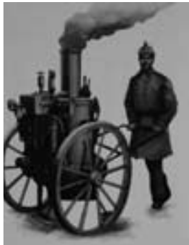
Паровая пожарная труба ручной тяги

Низкая боевая готовность курских пожарных вызывала законное недовольство горожан, так как в случае возникновения пожара в одном доме возникала реальная угроза его распространения на другие дома. Летом 1892 года на имя Курского губернатора поступает коллективное письмо от жителей города, в котором они высказывают свою озабоченность состоянием пожарной охраны. Куряне рисуют яркую картину плачевного состояния пожарных и пожарного обоза. Они пишут о том, что курская пожарная команда влачит нищенское существование: средствами, выделяемыми из городского бюджета, распоряжаются полицейские приставы, и деньги до пожарных не доходят, они же (приставы) фактически распоряжаются пожарными командами, лошади пожарного обоза используются по их распоряжениям не по назначению. Пожарные служители, пишут горожане, ходят грязными и оборванными, выполняют работы, не связанные со своими обязанностями. Учения не проводятся, пожарные обучены слабо. По мнению жителей, подписавших письмо, не отвечает занимаемой должности и брандмейстер — 70-летний старик ни по своим деловым, ни по своим хозяйственным качествам уже давно не способный руководить городской пожарной службой.